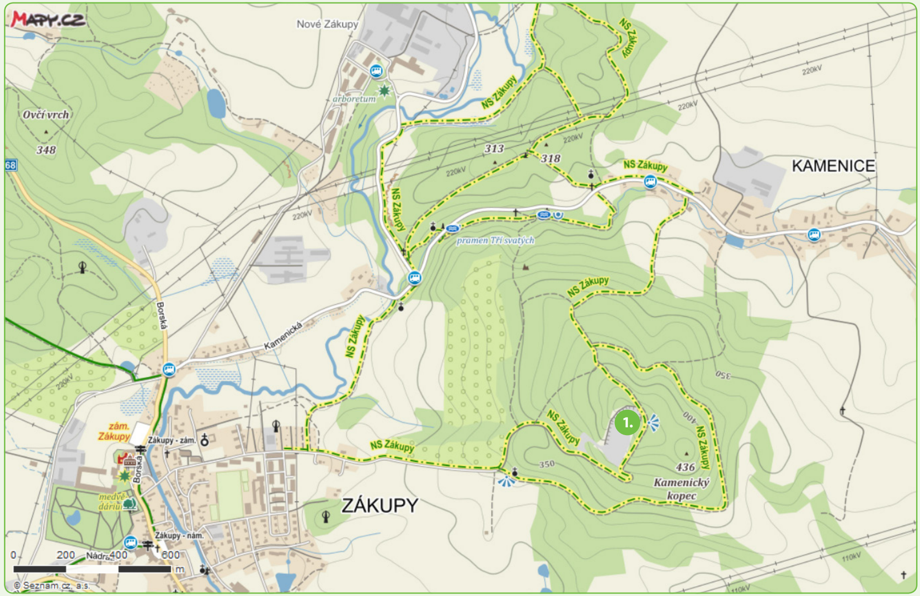
1. opuštěný lom na Kamenickém vrchu