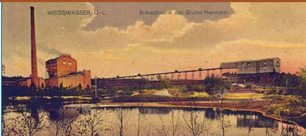
Brikettfabrik und Separation der Grube Hermann um 1911