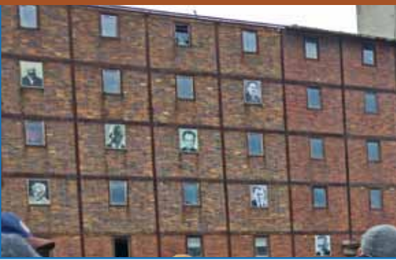
Neufert-Bau mit Portraits

Existuje však i druhé jméno: Wilhelm Wagenfeld - Možná je vám toto jméno také neznámé? Neufert i Wagenfeld ve Weißwasser chvíli zůstali. Wagenfeld předtím studoval na světoznámém Bauhausu ve Výmaru a poté byl profesorem v Berlíně. Nyní tedy přišel do Weißwasser a převzal umělecké vedení Spojených lužických skláren (VLG). Weißwasser byl v té době světově proslulý výrobou skla; nebylo místo, kde by se vyrábělo více skla a mělo tolik skláren! A skleněné výrobky Wagenfeld jsou světově známé dodnes! Centrální sklad se brzy stal nezbytným pro mnoho produktů šesti společností VLG a Wagenfeld k tomu pozval svého bývalého kolegu z Bauhausu Ernsta Neuferta.