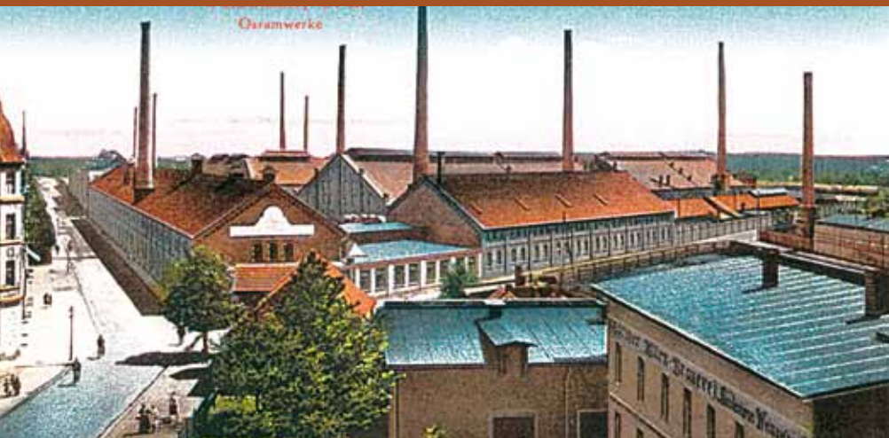
Blick auf die Osramwerke und die Josephstraße (heutige Straße der Einheit) um 1920

V té době zde funěly velké parní lokomotivy, tankovaly vodu z protější vodárenské věže a táhly nákladní vlaky s obrovským množstvím uhlí, písku nebo dřeva. Další budovou ve sklářské historii Weißwasser je tzv. TELUX - sklárna, která byla založena v roce 1899. Z vlakového nádraží musíte jít po Bahnhofstrasse k semaforu, pak odbočit doleva na Muskauer Strasse a poté třetí ulicí vpravo (Karl-Marx-Strasse). Za tržišťem je místo, kde kdysi býval nejvýznamnější světový výrobce baněk a zářivek. Jen se zeptejte svých rodičů, jestli znají "Osram"! Ve skutečnosti byl Osramwerk v té době největší sklářskou huť na světě. V Evropě se snad nenajde domácnost, která by se obešla bez žárovek od Osramu. Nejstarší dodnes existující budovy pocházejí z roku 1910, přičemž komín na Hermannsdorfer Straße pravděpodobně pochází dokonce z roku svého založení (1899). V současné době většina z nich slouží jako kanceláře.