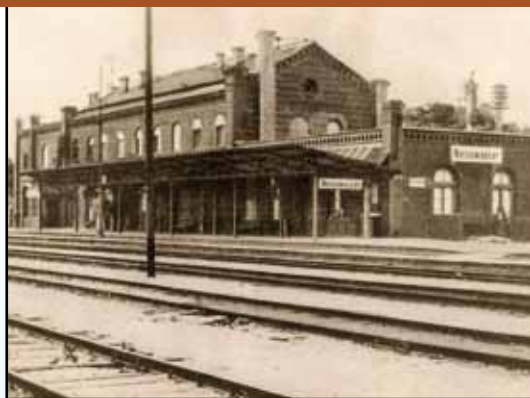
Bahnhof Weißwasser, Empfangsgebäude und Bahnhofswirtschaft (Gleisseite), um 1920

Město Weißwasser / O.L. je neodmyslitelně spjata s tradicí výroby skla. Průmyslové stavby jako sklárny a zpracovatelské závody, měšťanské domy a vily z doby sklářského boomu charakterizují dnešní panoráma města. Se ztrátou významu výroby skla a městské přestavby od roku 1990 hrozí, že příběh, který kdysi dělal lidi hrdé a bohaté, vybledne.